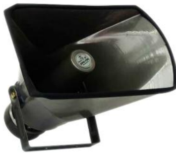
Corneta de VOZ