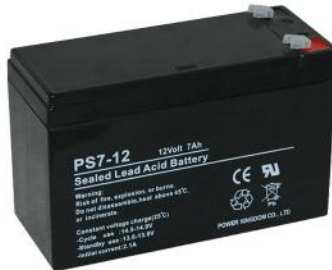
Bateria 12V -7A