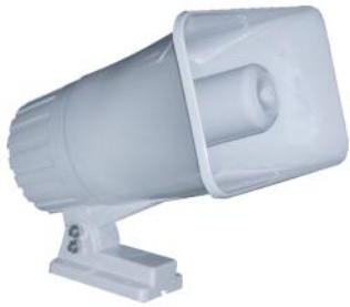
Corneta de VOZ