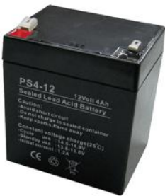
Bateria 12V -4A